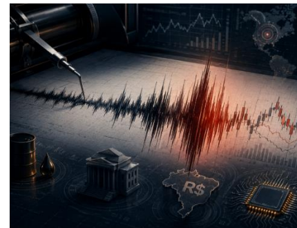
Estimativas das taxas SELIC

O gráfico abaixo mostra as estimativas das taxas SELIC implícitas pela curva de juros nos próximos trimestres no meio de abril e as atuais. É impressionante como em pouco mais de um mês as expectativas mudaram: